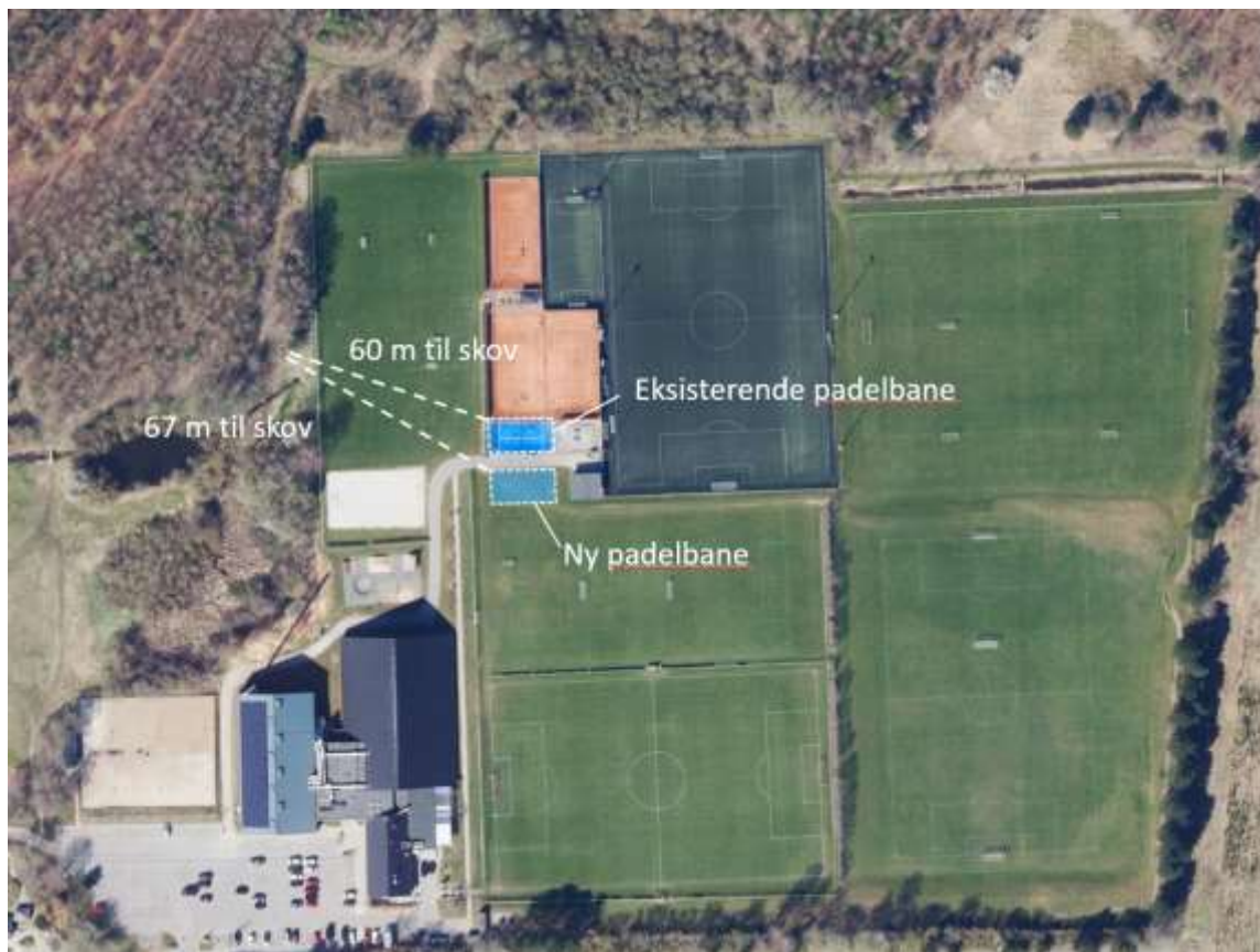
Figur 2 - Placering af padelbaner samt afstand til skov